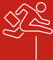
Aumento della concorrenza