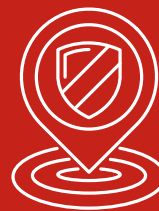
Varietà degli obblighi assicurativi locali